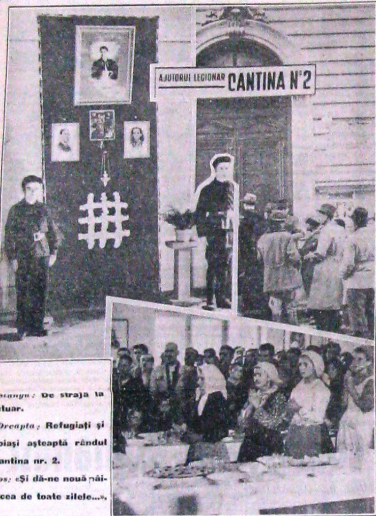
Stanga: De straža la sancțuar. Dreapta: Refugiați și nevoiași așteaptă rândul la cantina nr. 2. Jos: «Și dă-ne nouă mâine cea de toate zilele...»

Nu a trecut decât o lună de când «Ajutorul Legionar» și-a început activitatea.